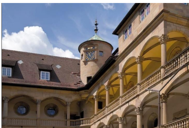
Innenhof Altes Schloss

Stuttgart ist eine farbenfrohe Stadt voller Geschichte(n). Die liebevoll restaurierten, alten Gemäuer in der Innenstadt erinnern an lustige, seltsame und dramatische Geschehnisse aus vielen Jahrhunderten. Vor Originalkulissen erzählt, machen alte Legenden und Anekdoten den Rundgang durch das historische Herz der schwäbischen Landeshauptstadt so spannend und unterhaltsam wie einen Abenteuerroman. Bei dieser kleinen Reise durch die fürstliche und bürgerliche Vergangenheit lernen Sie Stuttgart von einer ganz anderen Seite kennen!